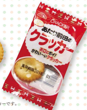
C-7 プチあたり前田のクラッカー → P.13

あたり前田のクラッカーの プチバージョン。 食べやすいミニサイズクラッカーです。