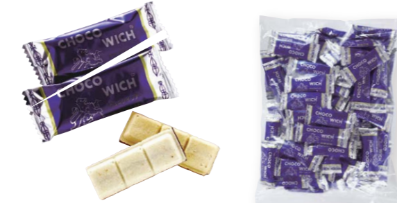
チョコレートを手焼きウエハースでサンドした欧風菓子のロングセラー。 B-24 チョコウィッチ ●規格/500g×10袋 ●外装JAN/4531321000319 ●賞味期限/365日 ●1kg個数/約210個 ●ケースサイズ(mm)/縦460×横250×高290