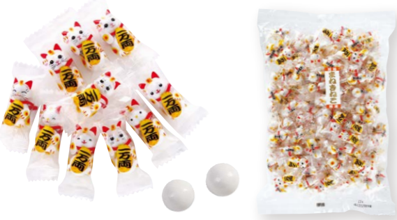
10種類のかわいいまねきねこ招福干支札のパッケージを白く糖衣したチョコボール。 B-21 まねきねこのチョコレートボール ●規格/500g×10袋 ●外装JAN/4946544015000 ●賞味期限/365日 ●1kg個数/約303個 ●ケースサイズ(mm)/縦465×横265×高165