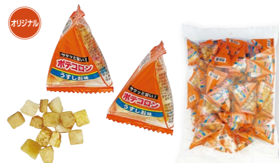
バキュームフライ製法でダイスカットしたポテトを塩味で味付けしました。 C-1 ポテコロン うすしお味 3g ●規格/50個×8袋 ●個装JAN/45203329 ●外装JAN/45203329 ●個装JAN/45203329 ●賞味期限/180日 ●ケースサイズ(mm)/縦400×横290×高235