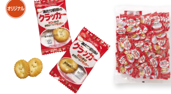
あたり前田のクラッカーのプチバージョン。食べやすいミニサイズクラッカーです。 C-7 プチあたり前田のクラッカー ●規格/100個×6袋×2合 ●外装JAN/4582218057206 ●個装JAN/4582218057046 ●賞味期限/180日 ●ケースサイズ(mm)/縦429×横302×高476