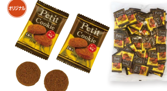
チョコレート風味のクッキーを食べやすく個包装にした商品です。 C-8 プチクッキーチョコ風味 ●規格/100個×6袋×2合 ●外装JAN/4589704430253 ●個装JAN/4589704430253 ●賞味期限/240日 ●ケースサイズ(mm)/縦429×横302×高476