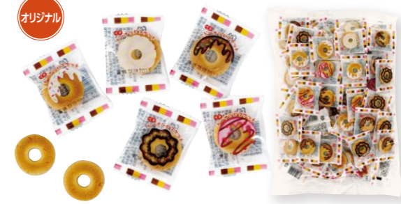
サクッとした食感のドーナツ型ビスケット。個包装のデザインもドーナツをイメージした商品です。 C-6 プチドーナツビスケット ●規格/100個×10袋 ●外装JAN/4582218056155 ●個装JAN/4582218055929 ●賞味期限/210日 ●ケースサイズ(mm)/縦429×横300×高290