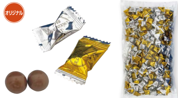
プチっとかわいいオールシーズンチョコを1粒ずつキラキラの個装にしました。 B-22 チョコレートボールピロ ●規格/500個×4袋 ●外装JAN/4582218053512 ●賞味期限/365日 ●ケースサイズ(mm)/縦429×横302×高238