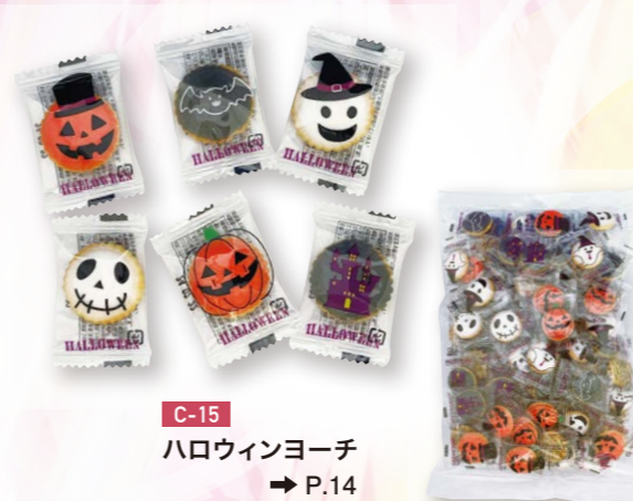
C-15 ハロウィンヨーチ → P.14

9種類のハロウィンにちなんだ柄を デザインした一口サイズの ヨーチクラッカーです。