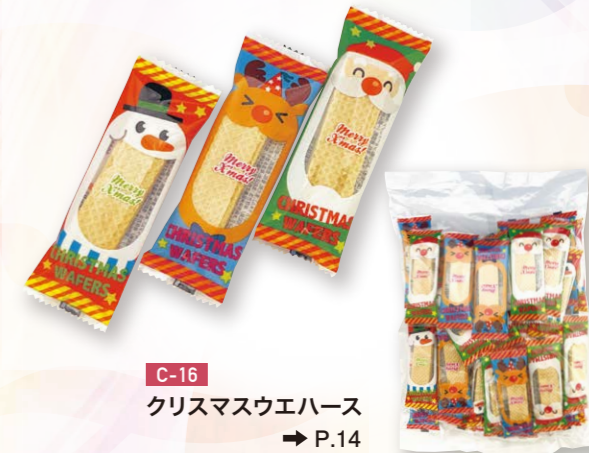
C-16 クリスマスウエハース → P.14

サクッと軽い歯触りが特徴の ウエハースにクリームをサンドした、 クリスマスデザインです。