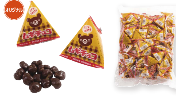
香ばしい麦ポップにチョコレートをコーティングし、テトラ包装にしています。 B-26 麦チョコテトラ ●規格/100個×10袋 ●外装JAN/4582218057183 ●個装JAN/45180736 ●賞味期限/300日 ●ケースサイズ(mm)/縦490×横326×高×339