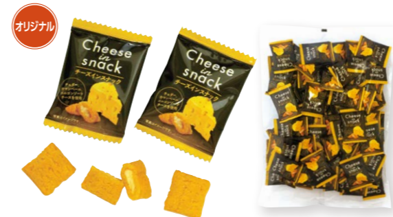
チェダー、カマンベール、ゴルゴンゾーラチーズを使用した風味豊かなスナック菓子です。 C-3 チーズインスナック 1個 ●規格/100個×6袋×2合 ●外装JAN/4589704430888 ●個装JAN/4589704430840 ●賞味期限/180日 ●ケースサイズ(mm)/縦429×横302×高476