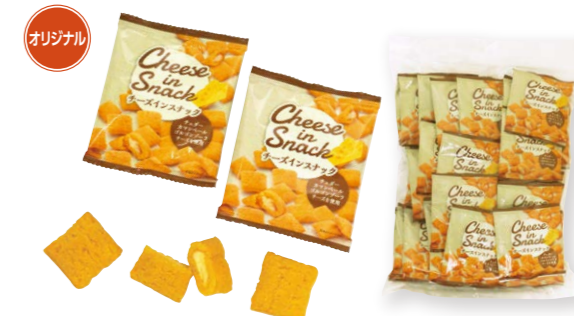
チェダー、カマンベール、ゴルゴンゾーラチーズを使用した風味豊かなスナック菓子です。 C-4 チーズインスナック 10g ●規格/30個×12袋 ●外装JAN/4589704430895 ●個装JAN/4589704430857 ●賞味期限/180日 ●ケースサイズ(mm)/縦490×横326×高339