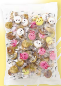
C-5 アニマルヨーチ → P.13

見た目は醤油容器にそっくり! ボトルの中身は、香ばしい麦 ポップにチョコレートコーティ ングしています。