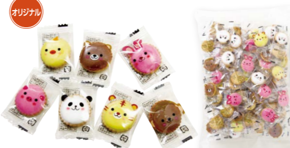
7種類の動物(パンダ・クマ・サル・ひよこ・ウサギ・ぶた・トラ)をデザインした一口サイズのヨーチクラッカーです。 C-5 アニマルヨーチ ●規格/100個×10袋 ●外装JAN/4582218057558 ●賞味期限/210日 ●ケースサイズ(mm)/縦429×横302×高238