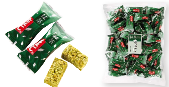
抹茶チョコにコーンフレーク、コーンパフを練り込んだクランチチョコ。 B-23 抹茶ちょこし ●規格/500g×10袋 ●外装JAN/4956439006228 ●賞味期限/150日 ●1kg個数/約165個 ●ケースサイズ(mm)/縦400×横280×高310