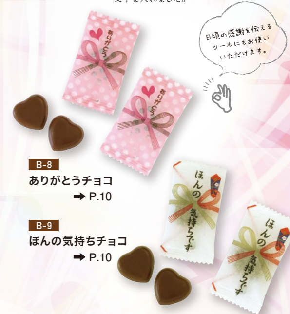
B-8 ありがとうチョコ → P.10

ハート型のチョコを個包装に 「ありがとう」「ほんの気持ちです」の 文字を入れました。