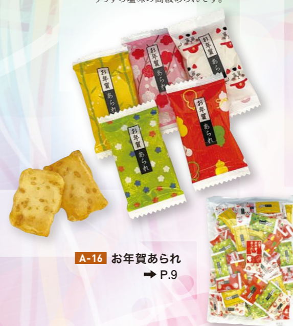
A-16 お年賀あられ → P.9

新年のお祝い、ご挨拶にぴったりな お菓子です。高級もち米を使用、 うっすら塩味の高級あられです。