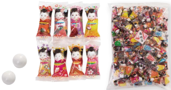
華やかな着物をまとった、舞妓さんのチョコボールです。 B-19 舞妓姿のチョコレートボール ●規格/500g×10袋 ●外装JAN/4946544034001 ●賞味期限/365日 ●1kg個数/約303個 ●ケースサイズ(mm)/縦465×横265×高165