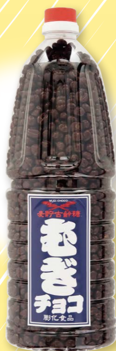
E-10 麦チョコボトル → P.18

見た目は醤油容器にそっくり! ボトルの中身は、香ばしい麦 ポップにチョコレートコーティ ングしています。