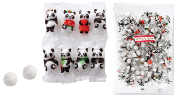
白く糖衣したチョコボールを10種類の可愛いパンダパッケージで仕上げました。 B-20 パンダのチョコレートボール ●規格/500g×10袋 ●外装JAN/4946544017004 ●賞味期限/365日 ●1kg個数/約303個 ●ケースサイズ(mm)/縦465×横265×高165