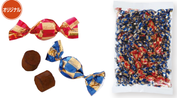
まろやかで口の中でとろけるような高級感のある生チョコタイプのチョコレートです。 B-25 ピュアーチョコ ●規格/500g×12袋 ●外装JAN/4902486307191 ●賞味期限/365日 ●1kg個数/約200個 ●ケースサイズ(mm)/縦410×横240×高299