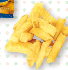
C-10 じゃがってる → P.14

あたり前田のクラッカーの プチバージョン。 食べやすいミニサイズクラッカーです。