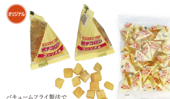
バキュームフライ製法でダイスカットしたポテトをコンソメ味で味付けしました。 C-2 ポテコロン コンソメ味 3g ●規格/50個×8袋 ●個装JAN/45203336 ●外装JAN/45203336 ●個装JAN/45203336 ●賞味期限/180日 ●ケースサイズ(mm)/縦400×横290×高235